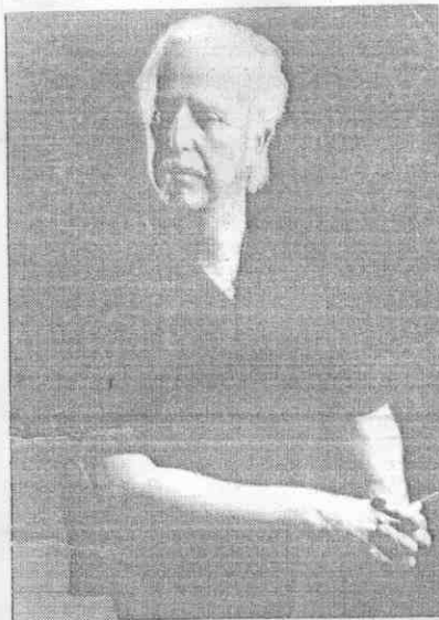
◁ 斯萊可尼 ◦ 師術魔的場劇是