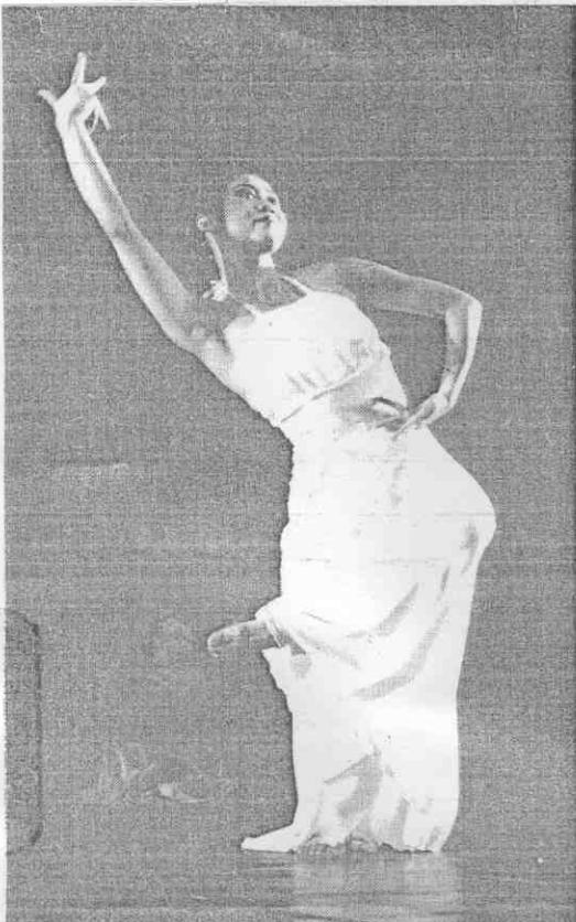
△「魚玄機」的十分是勢手的方東的。▷男女之間的感情糾葛，在「魚玄機」中佔了很大的地位。