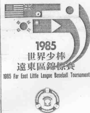
中華民國七十四年七月廿七日(八月二日) 台北中華體育大學 July 27-August 2 1985 Taipei Municipal Baseball Stadium

【本報訊】中華少棒隊昨(三)晚力戰韓國，可惜以一比二失利，痛失遠東區少棒賽王座及參加世界少棒賽的資格。