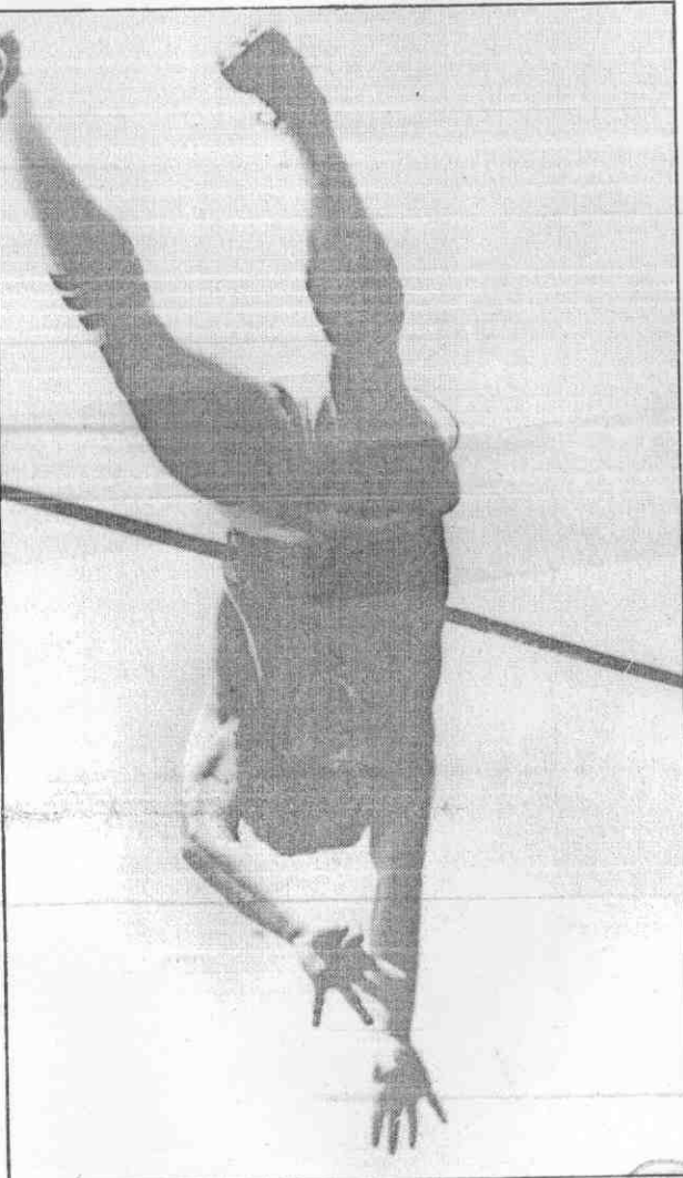
刻一的錄紀界世下創，尺公六過跳竿撐卡布手選俄蘇

【美聯社巴黎十三日電】蘇俄選手布卡十三日在巴黎國際田徑賽上打破自己保持的撐竿跳世界紀錄，成為史上第一位跳過六公尺（十九呎六八）的選手。二十二歲的布卡在第三次跳的時候，刷新自己五公尺九四（十九呎四八）的上一個世界紀錄。上個世界紀錄是去年八月三十一日他在羅馬締造的。布卡創紀錄的一跳，前胸輕觸橫竿，但橫竿並未落下。落地後的布卡高舉雙手作勝利狀，攝影記者及道賀人士立即蜂擁而上。