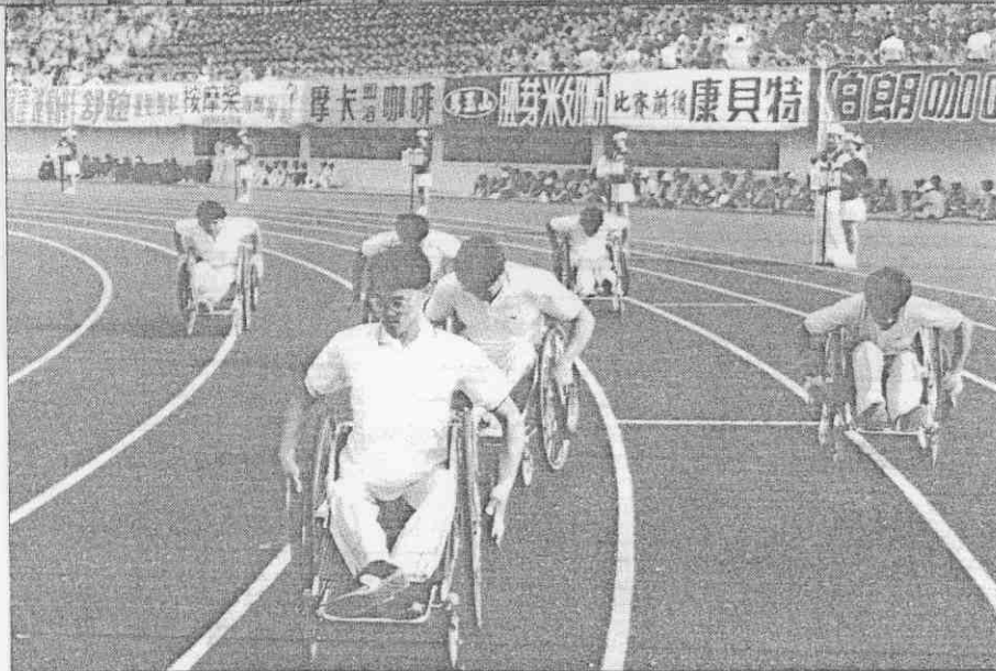
會盛運區的度一年一與參會機有也年青障殘使，速競尺公百四椅輪的辦舉前禮典幕閉△（攝組小影攝運區報本）