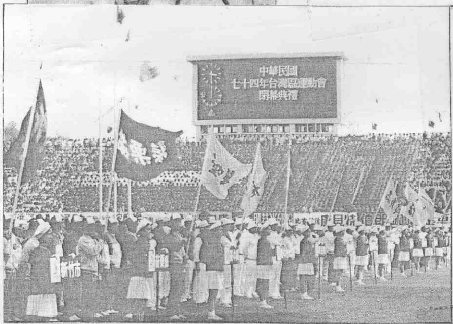
見雄高年明約相，禮典幕閉加參容陣的齊整以員動運，束結賽比天五△（組小影攝運區報本）