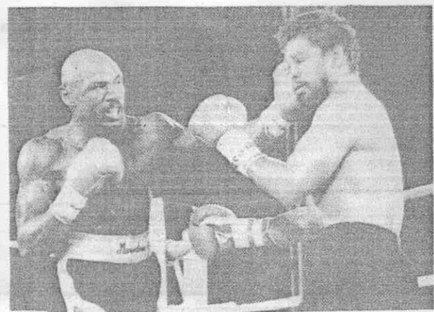
「光頭拳王」哈格勒(左)迎戰杜南進行第八度衛冕，鏖戰十五回合才以點數獲勝。

翌年九月十六日拳王頭銜被李納德摘掉了，這場拳賽當年相當轟動，打了十四回合希恩斯被擊倒，寫下了他拳擊生涯唯一的敗績。 一九八二年底希恩斯在十五回合擊倒班尼茲，奪走了世界拳理超輕中量級拳王寶座。 在九年職業拳賽生涯，希恩斯打四十一場，勝四十場，其中三十四場擊倒，擊倒率相當高。而哈格勒是打六十四場勝六十場，五十場擊倒。 一般認為，哈格勒、希恩斯的戰，究竟鹿死誰手很難預料，雖然賭場盤口起初看好哈格勒，但目前已很接近，畢竟兩人都非等閒人物，都是當今拳壇中量級最傑出的拳手，擊倒或被擊倒都有百分之五十的可能性。