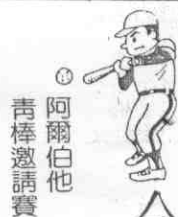
阿爾伯他 青棒邀請賽