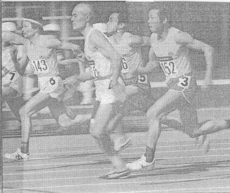
嗎人的歲十五像，兒勁的命賣們他看▲

，心重去失却體身，手出槍標▲ 。地伏手雙緊趕將老