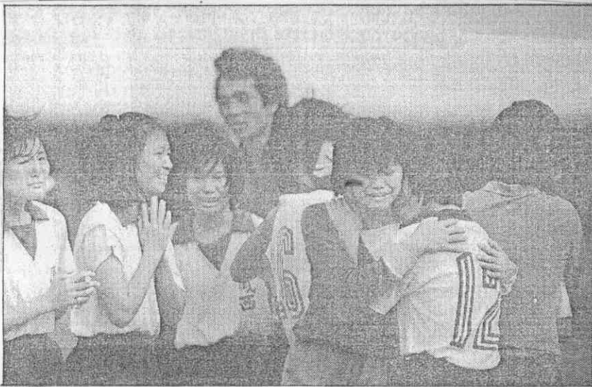
也喜極而泣。 鳳西國中女足歷經苦戰力克永平後，球員