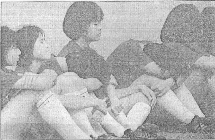
員坐地抱頭痛哭。 永平國中女足在加踢十二碼球落敗後，球