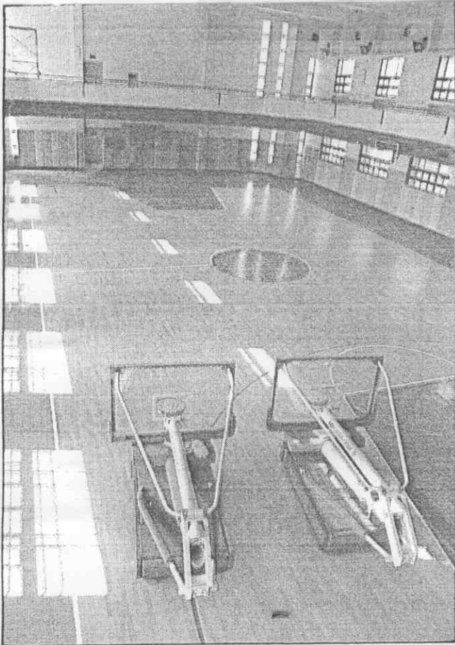
▲國泰隊的重量訓練設備。 電信女籃隊新新的專屬球場。