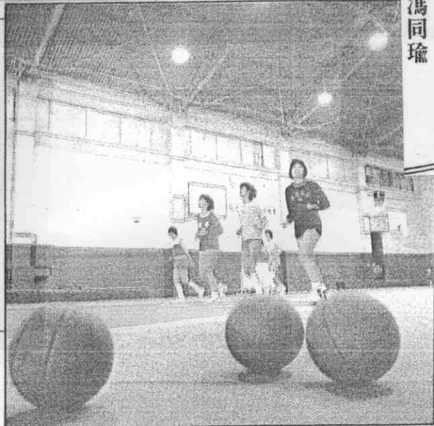
▲華航球場設備在內坪，球員們在鋪的。