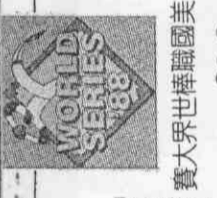
費大世界世棒職國美

日本NHK衛星電視已決定轉播這七場比賽，第一、二場由台北時間廿二日、廿三日六時起，三、四、五戰由六時半起，六、七戰由六時起播出。(劉滌昭)