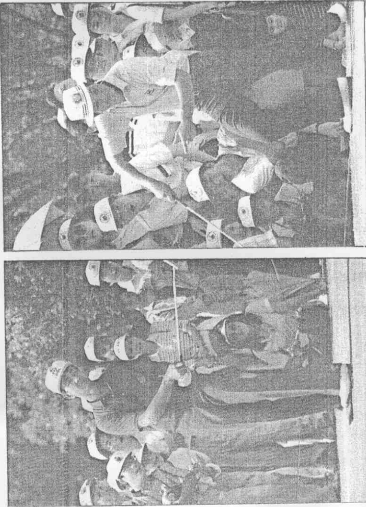
汪冷把捏眾觀，進不粹推哥三阿：圖左 。勇神桿推的男敏謝：圖右