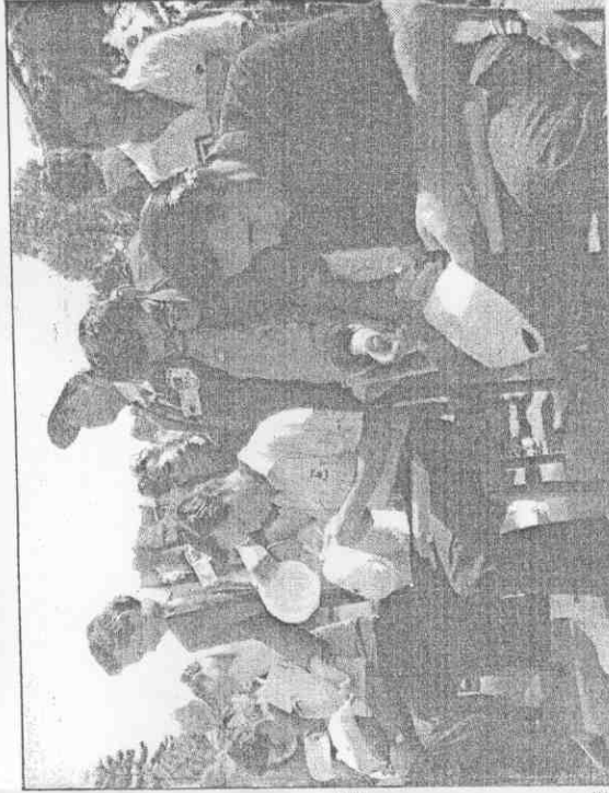
豐張手高點差單：圖上右 份身長事理協體以（三右）緒 。影合們像偶的中目心他和 將名，畢完賽比：圖下右 。名簽著忙們 （攝興福張 者記報本）