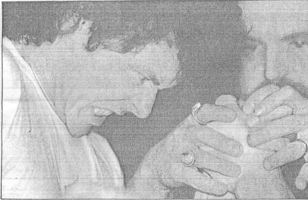
下右圖：在公平的原則下，腕力比賽用的桌子及道具，規定明細而嚴格。 下左圖：甫一接觸即可感受動力迸射，裁判正檢查選手雙腕是否握緊。