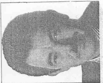
① 大龐積面中 運奧球全。 模塔送傳訊電型。 爾加拉馬長市主 匪獻貢權辦選。 會備權為選獲。 席主 團訪探運奧報本 導報線聯北台一城漢