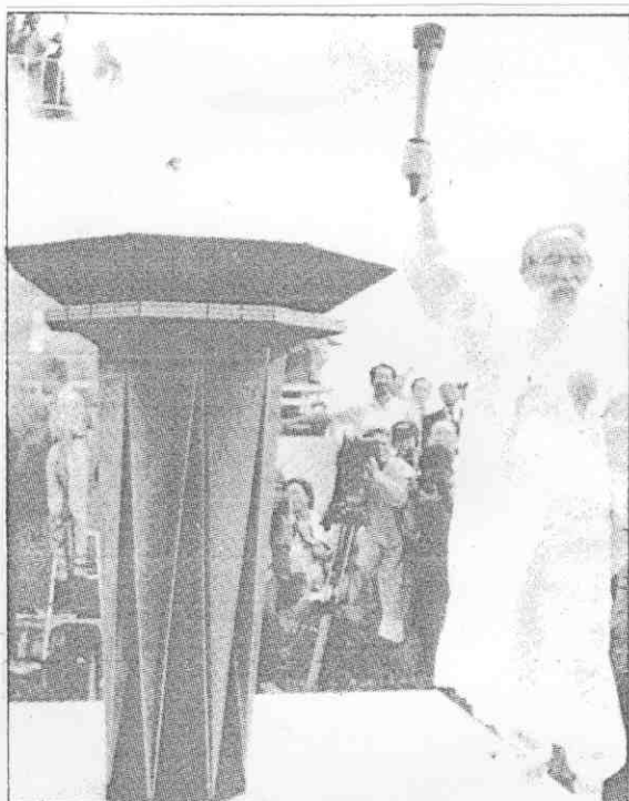
▲奧運聖火在抵達濟州島後，由濟州島一名長者手持火炬點燃濟州島聖火台，隨後交與第一階段聖火傳遞兩名南韓少年。

燃的奧運聖火，二十七日抵達濟州，展開為期三週的接力賽，聖火將越過南韓，抵達漢城，將在奧運揭幕式引燃。