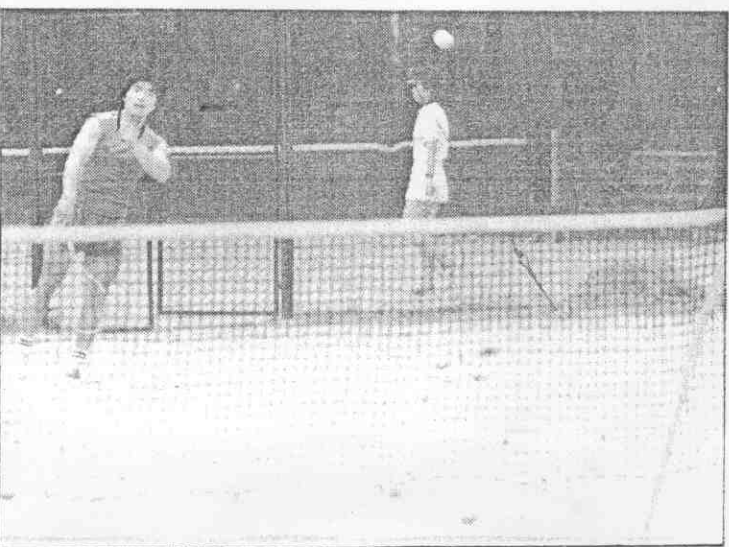
上圖：北京體育學院正在「緊張施工」，這兩座體育館，一作亞運拳擊、一作韻律體操比賽用。 下圖：中華軟網曾是世界冠軍，但從未見過大陸選手打軟網，這是北京體育學院的訓練基地，球具由日本供應，球網中間有一支木桿協助撐起。