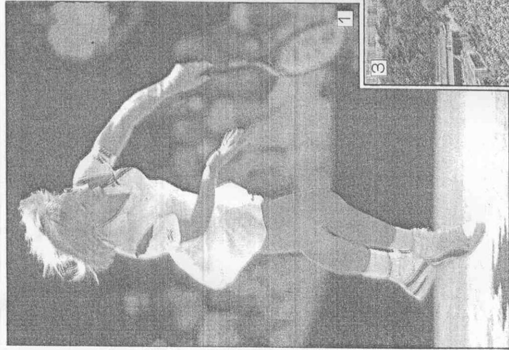
① 娜拉提諾娃這次在法國公開賽將爭取她第十八個大滿貫的單打冠軍。