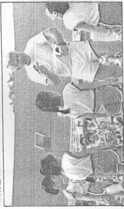
▲海爺爺告訴小朋友，玩球時要觀察四週。