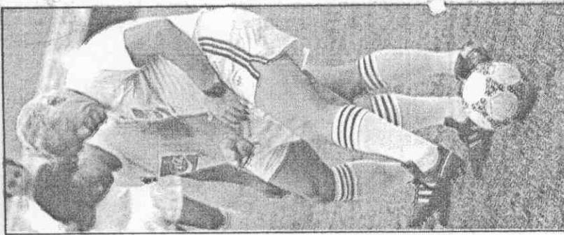
▲假動作之後，如何活用腳跟傳球。