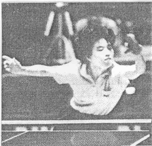
。落俐淨乾，殺扣手正的香美野星▲