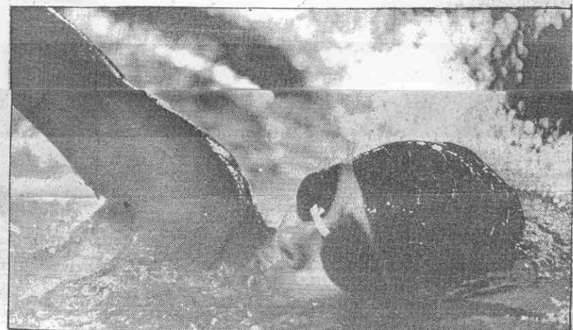
一九秒四廿為績成，錄紀快最國全式由自尺公十五出游禮基姜▲