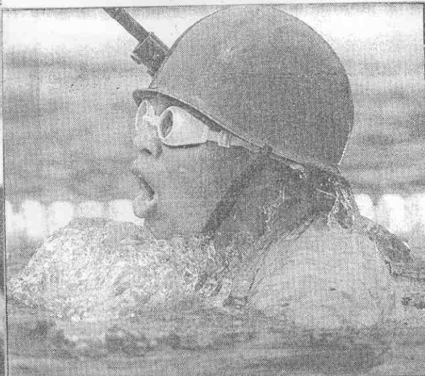
武裝游泳可不簡單，比平時費力得多。