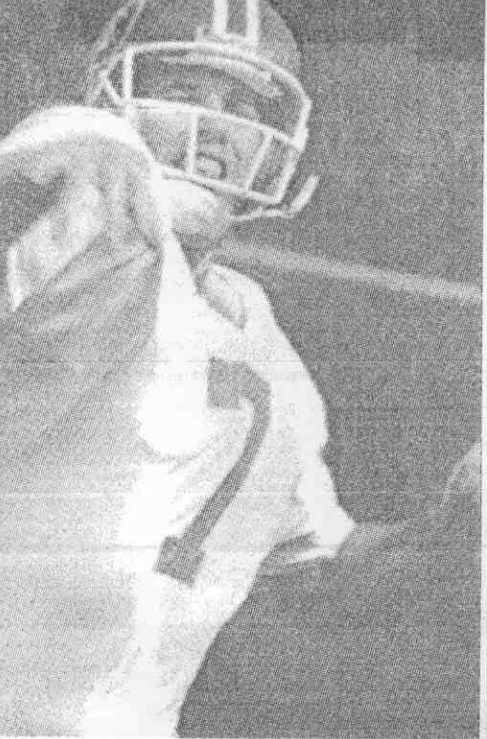
丹佛野馬隊四分衛艾威(左)與華盛頓紅人隊四分衛威廉斯(右)於超級杯決賽前做最後練習。