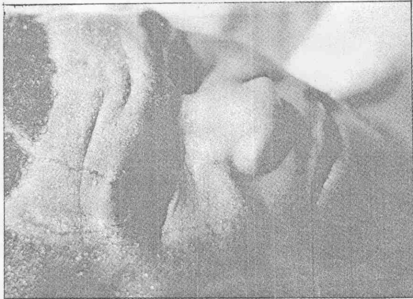
▲緊握的雙臂是泰森的標誌，但他的沈默正是爆炸性威力爆發的原動力。