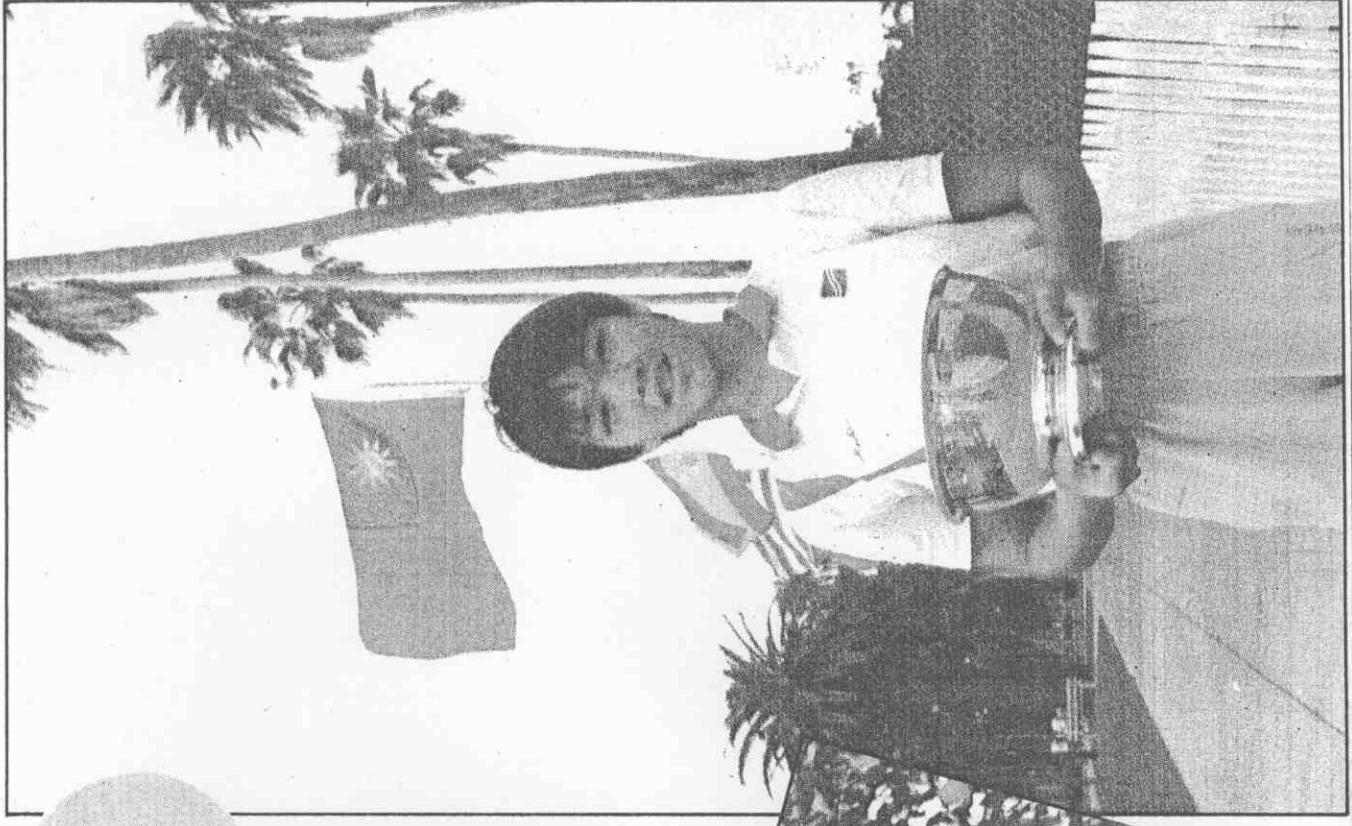
傳依婷思王，杯軍冠了贏▼吃家大請橘甜下摘樹子橘從統。