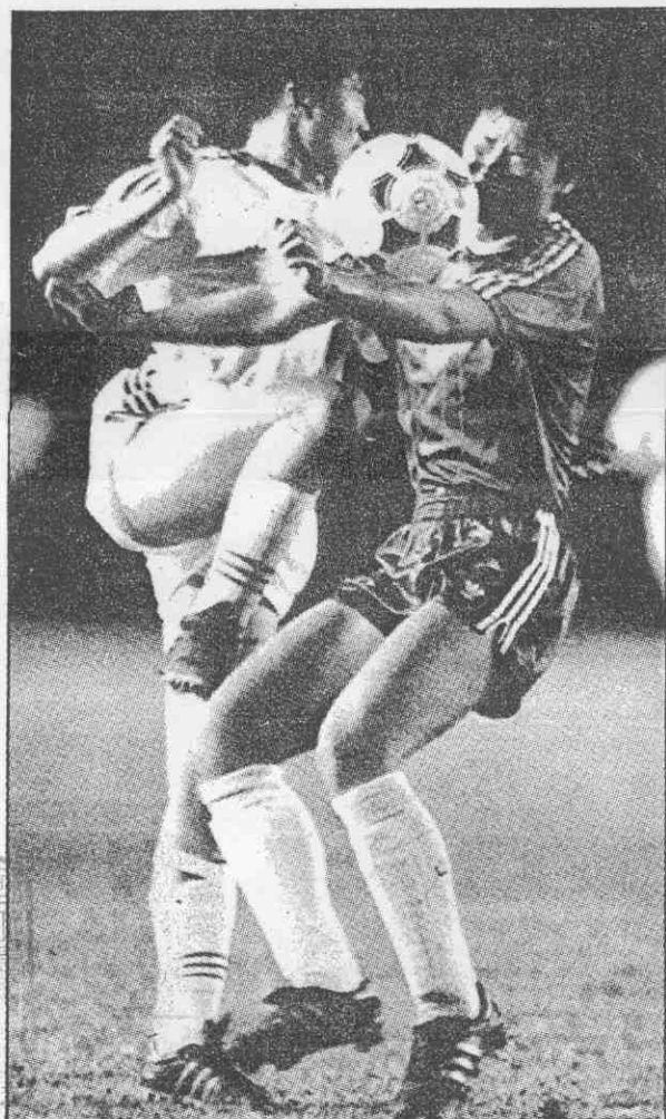
↑亞洲杯女足賽，大陸隊(左)出戰北韓，雙方為了一球，似乎不惜拳腳相向。

B組目前日本與香港同為1勝，領先各輸1場的印尼及尼泊爾，明晚日本與香港對陣，日本的實力在這組一枝獨秀，應可以分組冠軍出線。