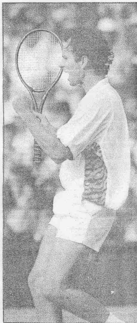
80年代名氣最大的兩位男網巨星——藍道(左)和馬克安諾。