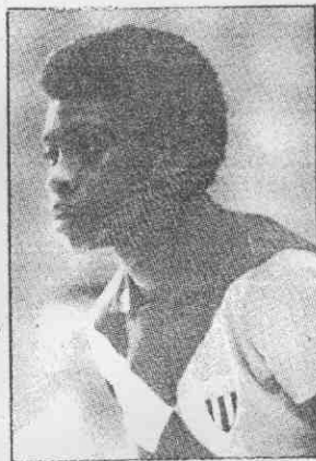
↑古巴的「跳人」路易絲，是最近五年新巨星。