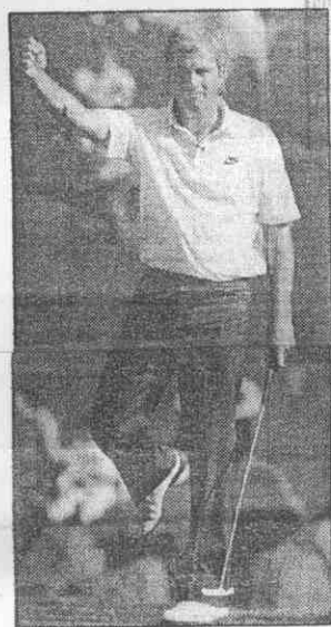
↑史川吉在4大金剛逐洞賽，最後1洞擊出博蒂獲勝後，舉起右拳歡呼。 美聯社傳真

17洞，佛洛德與尼克勞斯均博蒂平手，獎金延至18洞，結果，史川吉以25呎推桿，贏走了7萬獎金。