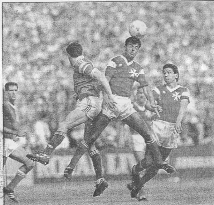
→南愛（綠衣）在會外賽擊敗同組的馬爾他。

無論如何，南愛就憑在歐洲國家杯擊倒英格蘭，以及逼和蘇聯的實力，仍將是這次世界杯隨時會有驚奇表現的「綠衫軍」。