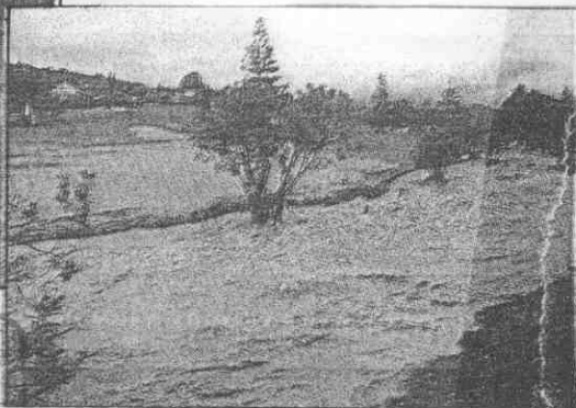
➔ 世界杯高球賽的比賽場地，受到大雨侵擾，球道邊溪流暴漲，比賽停止。