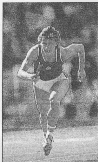
↑柯齊是近10年最傑出的女子短跑選手。