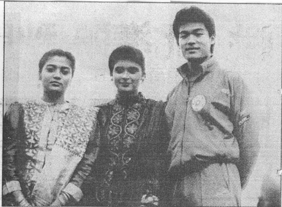
美女伴英雄 ↑金牌加冠，印度美女來相伴，乃慧芳跳遠真神氣。