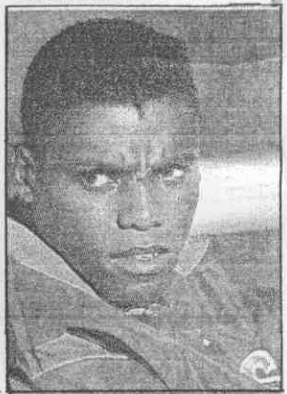
左：漢城奧運被取消金牌後，強生在記者會上咬著嘴唇泣然欲泣。 右：劉易士曾多次指控強生服用禁藥才贏了他。