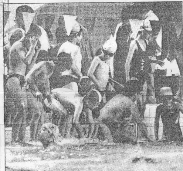
↑50公尺自由式進行前，大會破例給選手們十分鐘熱身，一時池中撲通跳下無數娃娃魚。

但女青年會以付費教學方式，成功的帶出競賽型選手，則是泳壇少見而合乎國際潮流的方向，女青年會能成功，自擁溫水游泳池，又有大規模學術理論為後盾也是關鍵，雖非一般基層泳站可一蹴而幾，其未來發展，卻值得有關體育主管單位注意，既然民間確已有實力作到自主自力去培養選手，就應當積極鼓勵各縣市政府善盡輔導。