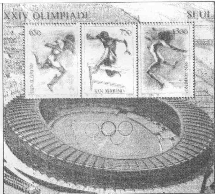
↑ 聖馬利諾以田徑為主題發行的三連式郵票獲得銀牌獎。