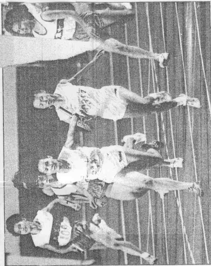
四任擔，陣上掛披市雄為年今，(中)秀麗林將老的年多失消場徑徑從田從。牌金下崗利順，出突現表棒一後最力接百