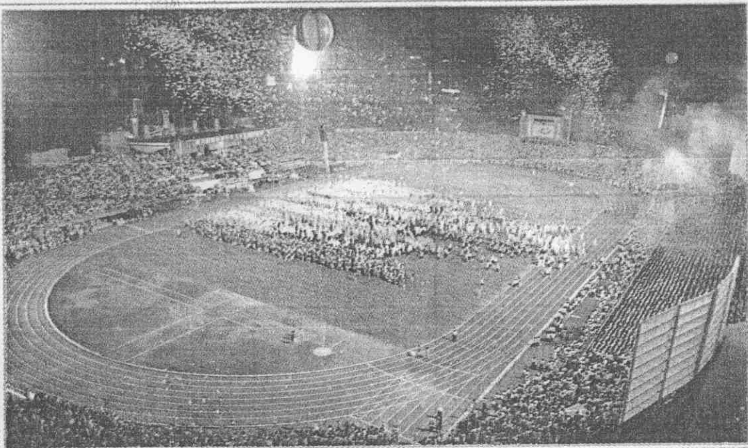
圖片說明：(右)區運揭幕，五彩氣球冉冉升空，雷射及焰火點出莊嚴熱鬧的氣氛。(左)旅日棒球明星王貞治，高舉聖火進場。