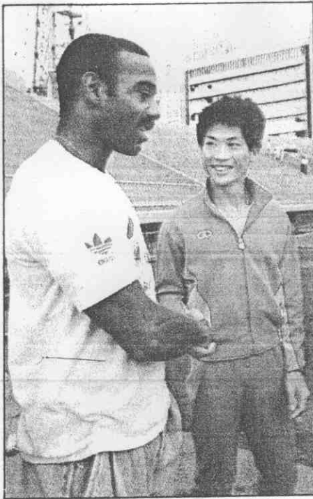
↑今年世界跳遠第一的麥瑞克斯 ↓麥瑞克斯與我國第一全賴正全緊握手。 ↓麥瑞克斯向民生報讀者問好。