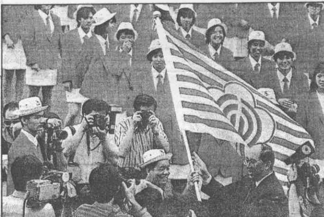
→ 吳伯雄授旗給北市區運代表隊，勉勵選手全力以赴並善盡「體育大使」職責。

吳伯雄授旗 期勉北市選手 場上力爭佳績 場外廣結善緣 【本報訊】台北市長吳伯雄，昨天在中山足球場為台北市參加區運的各運動代表隊授旗，期勉所有選手除力爭佳績外，更要善盡地主之誼。 吳伯雄在授旗中指出，今年區運在台北市舉行，身為地主身分，大家不但要爭取光榮，也應具有第一流的運動家精神，廣結善緣，扮演好「親善大使」，共同協助市政府辦好這次的區運。 台北市代表隊隊員一七四人，選手六八四人，總數八五八人冠於各隊，將角逐男三項團體金牌，及六卅四項、女廿三項競個亞軍、十三個季軍。 技，根據北市教育局及各單項委員會實力評估，自付可獲男子籃、排、網、桌等廿三面團體金牌，及六卅四項、女廿三項競個亞軍、十三個季軍。