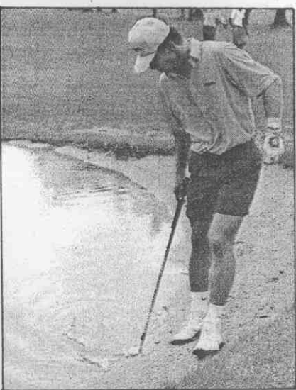
他，軍冠杯青亞去是根貞吳的國韓 ↑ 。桿短的區草亂練在 ，塘水成變坑沙，雨豪來帶風颳拉莎 → 。出撈中「坑水」從球把曼來蘇的亞西來馬

改為新加坡、香港、台北、漢城、日本，並將獎金提高為卅至四十萬美金。這項提案將於明年三月馬來西亞公開賽時決定。 ④九〇年亞洲青少年錦標賽定於四月五日於印尼雅加達舉行。 ⑤新加坡將於九〇年舉辦大規模的亞洲區業餘高爾夫賽，希望獲各會員國支持。