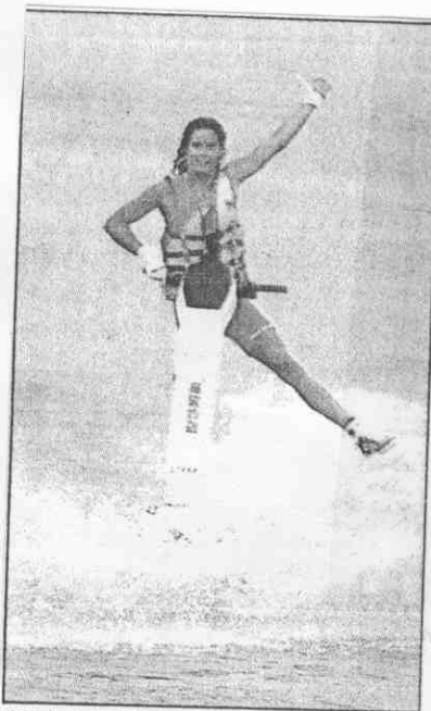
活上水天夏年今是車托摩上水↑ 。項一的多較件事外意動 (攝明壽楊 者記報本)