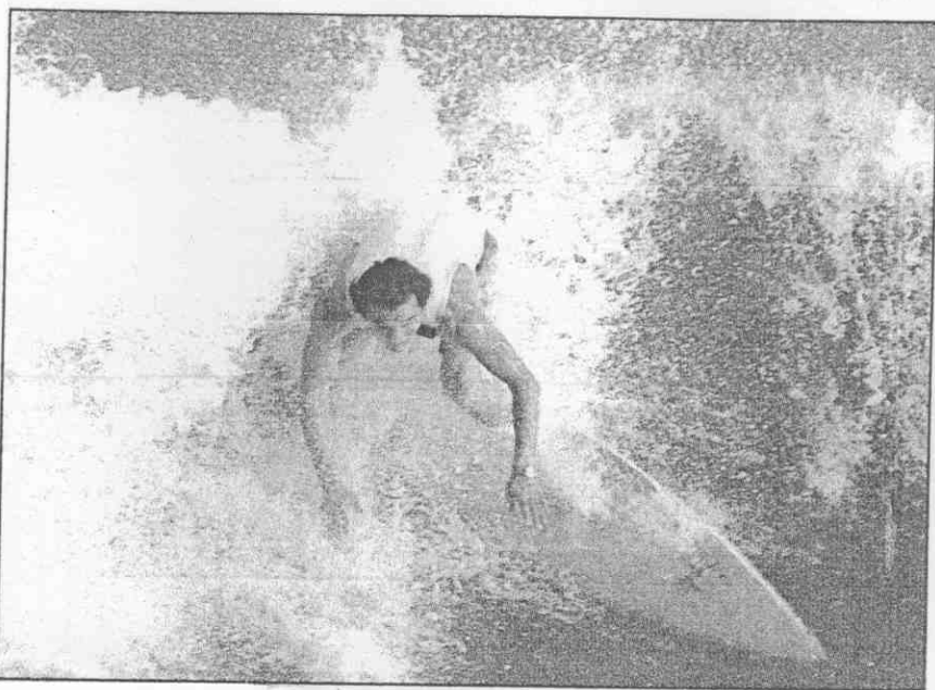
↑ 衝浪一直以兩個不同的訓練班為推廣基礎。

● 新的船型出現，各種新式器材的引進，加上國人消費能力的增強，使得今年各種水上活動的能力增加許多，也留下更多的問題需要解決。 動力船舶 遊艇管理辦法尚未通過，使得不少俱樂部東躲西藏，無法正規地玩，私人擁有的船隻也只能利用較少人注意的海灘下水，嚴格說來仍是非法的活動。