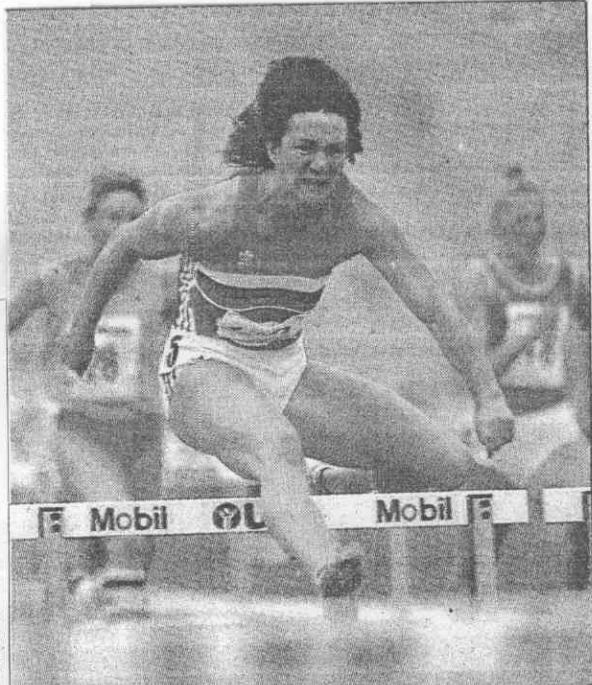
↑ 田徑實力日千里，唐可娃為保國贏得一百公尺 ↓ 奧運三級跳金牌名將馬可夫是保國「田徑之光」 也，一條訓練體系典型的代表。