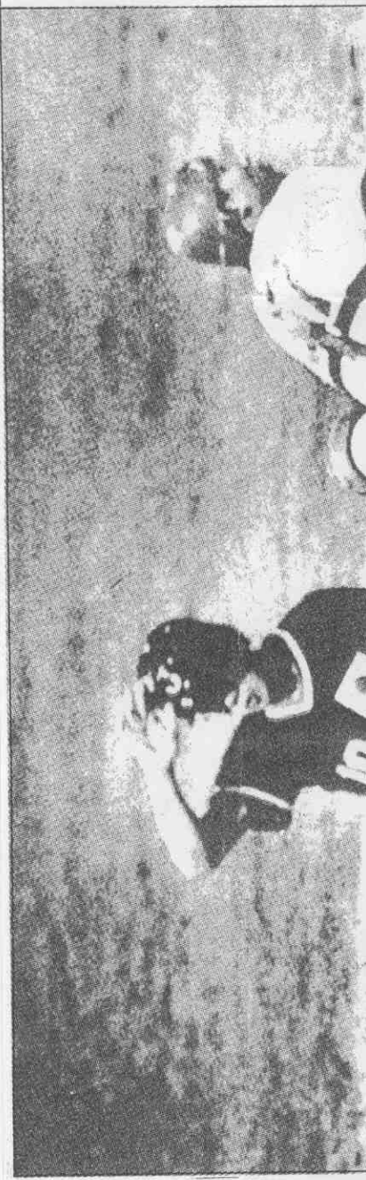
◀洲際杯成棒賽中、日之役，中華隊守備慢一拍。

杯洲亞 賽球棒 動更單名華中 代表隊 提出一 華隊球 助中華 季來 投手劉 三壘手 忠，前 隊的一 年青 今年 四日 中華隊