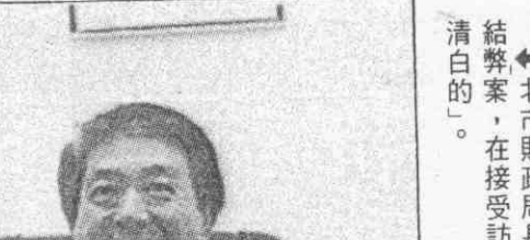
北市財政局長結弊案，在接受訪清白的。