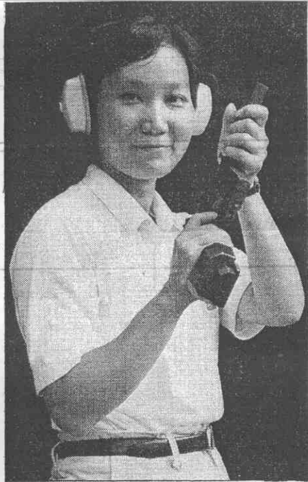
將女，拔選手國賽擊射亞南東↑ 五以槍手動運尺公五十二的台更錢 。芳群壓技，分三六