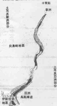
博斯普魯斯海峽縱渡圖