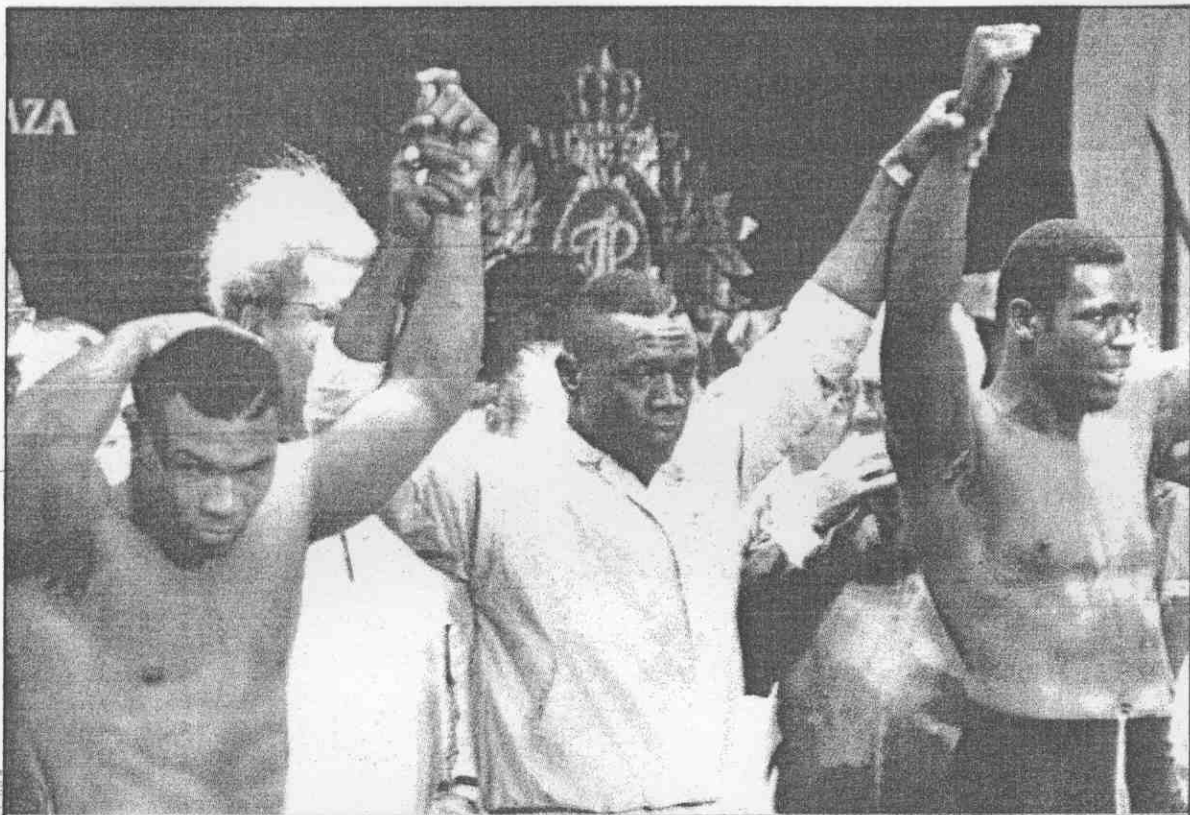
挑和(左)森泰的戰霸王爭王拳級量重界世行進午上日廿間時北台於將即↑ 記向，下導引的德沙哈席主會事理擊拳西澤新在日廿，(右)斯廉威者戰 格體的人兩示展者

聽聽訓練員怎麼說？ 泰森的：擬好新戰略 威廉斯的：直拳克蠻幹 【美聯社新澤西亞特蘭廿廿日電】世界重量級拳王泰森週五晚上迎戰挑戰者「真理」威廉斯，對他既定的拳壇評價可能無太大影響，不過對布萊特和史諾維爾可就大不相同。 取代羅尼成為泰森新的訓練員的上述二人，在元月廿五日泰森出戰英國拳王布魯諾的比賽後，備受批評。布萊特聲稱，泰森那場拳賽顯得有些生硬，是因為項事纏身，久未出賽所致。他說：「週五各位將可看到泰森處於巔峰狀況的表現。」 他倆採分工制，史諾維爾負責泰森的體能訓練，布萊特負責戰術部分，他們已擬好對抗威廉斯的戰略。 威廉斯的訓練員葛拉諾諾說，泰森那有什麼訓練員，他只有「一項戰略，那就是以蠻力打倒對手。他說，直拳是威廉斯阻止泰森蠻幹的有效策略。