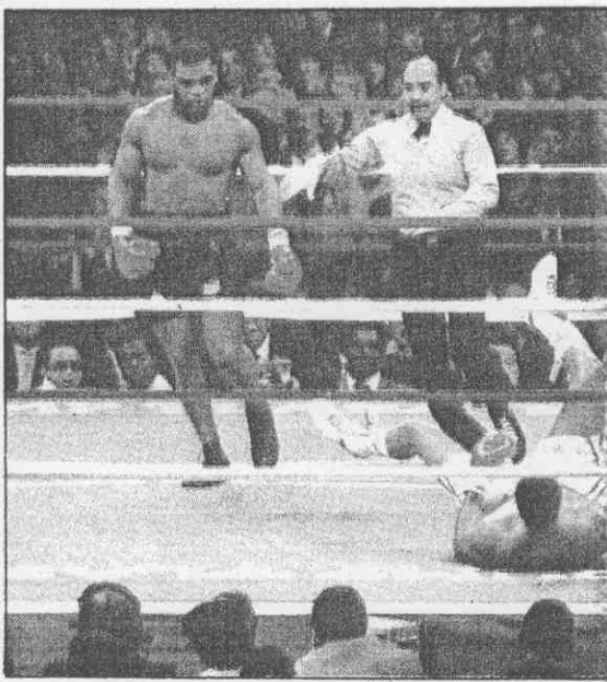
斯廉威對在會，「史歷」的倒擊泰被斯姆何↑ 嗎演重役之

戰績廿二勝二負，十七次擊倒對手的威廉斯表示，他不會被泰森的重拳嚇住。 他說：「我幹嘛要怕，我是靠這個吃飯的，我怎麼能怕挨打呢？我輕鬆自在得很。」 威廉斯表示，他比四年前對何姆斯時強悍得多。他說：「我已等了很久，我知道這會是一場硬仗，不過我胸有成竹。我要收拾泰森，現在是時候了。」