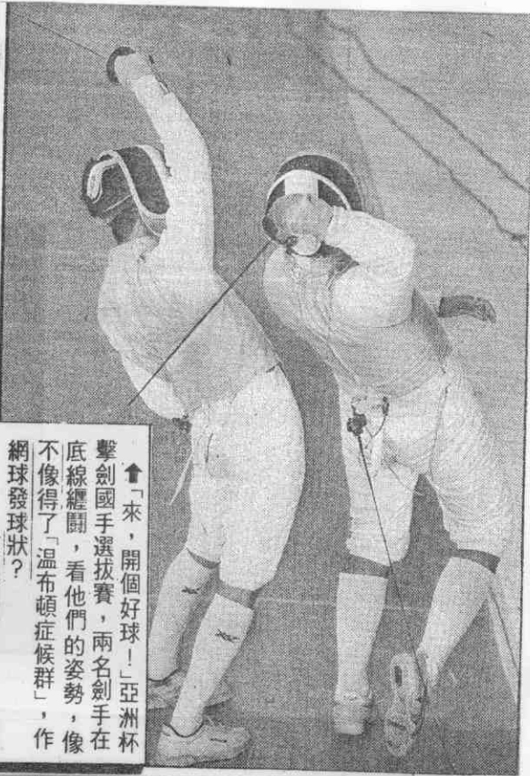
↑「來，開個好球！」亞洲杯擊劍國手選拔賽，兩名劍手在底線纏鬥，看他們的姿勢，像不像得了「溫布頓症候群」，作網球發球狀？