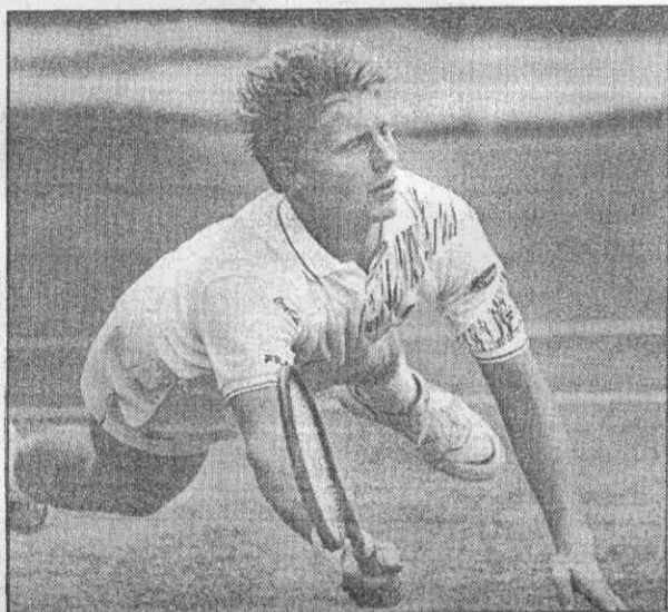
西德網球選手貝克拚勁十足，屢次撲倒截險球，獲今年溫布頓網球賽男子單打冠軍。