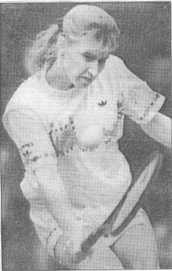
葛拉芙的強力反拍截球，壓制了女金剛，今年在溫布頓網賽衛冕成功。